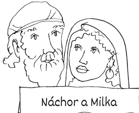
Náchor a Milka