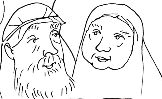
Terach a jeho žena

Háran zemřel ještě před svým otcem Teracehm v Kaldejském Uru. Terach vzal Abraháma, jeho ženu Sáru a vnuka Lota a vydal se s nimi z Kaldejského Uru do Cháranu. Tam se usadili a tam Terach zemřel.